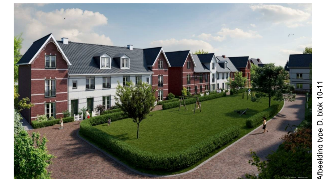
Abteiding type D, blok 10-11